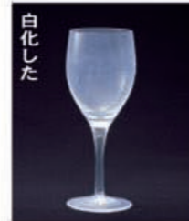
白化した 24%鉛クリスタル