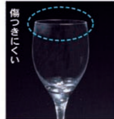
傷つきにくい ファインクリスタル イオンストロング

世界水準の輝きと光沢・透明感をもつ「ファインクリスタル」に当社独自のイオン強化加工技術「イオンストロング」を施すことにより、さらに強度がおよそ1.5倍*向上し、優れた耐久性を実現しました。(※当社比較試験より) グラス全体に強化加工をすることで、細脚・口肉薄のステムウエアも安心してお使いいただけます。