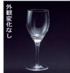
外観変化なし ファインクリスタル

「ファインクリスタル」は、鉛を原料に使用していませんので、アルカリ洗剤に強く、業務用食器洗浄機で4,500回洗浄しても、アルカリ焼け(白化)しません。